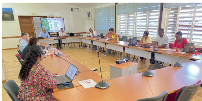
« Les ateliers « FONDS VERT », avec le CEP, et le webinaire « URCIT 1 » : actions de transition entre les deux actes

Adossé au filigrane socio-économique évoqué sur le premier acte, le réchauffement climatique complexifie d'autant la prise en compte, a minima, de l'esthétique et du confort, a maxima, du risque, dans l'urbanisme. En effet, avec 1 628 km 2 ; dont 135 000 ha de Parc, pour 390 000 habitants, la Guadeloupe est exposée à 6 risques naturels majeurs ainsi qu'au risque technologique (4 zones SEVESO).