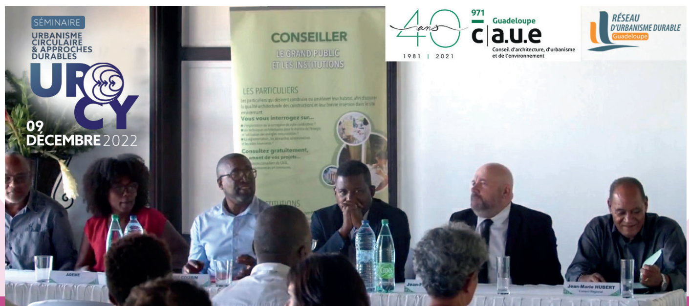
La signature de la convention multi partenariale en 2022, temps fort du volet « PATRIMOINE »

Socialement et politiquement, l'évolution « récente » des modes d'habiter, de construire et d'aménager, « au nom de la modernité », peut-elle s'accommoder, d'une nouvelle révolution induisant la rupture avec des pratiques linéaires et segmentées encore en vigueur ?